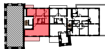
Implantation dans bâtiment